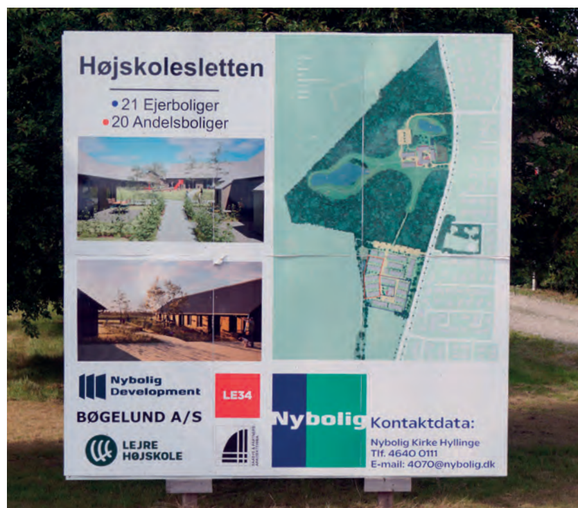
Interessen for det nye byggeri er allerede stor. Her kan du se placeringen af husene.