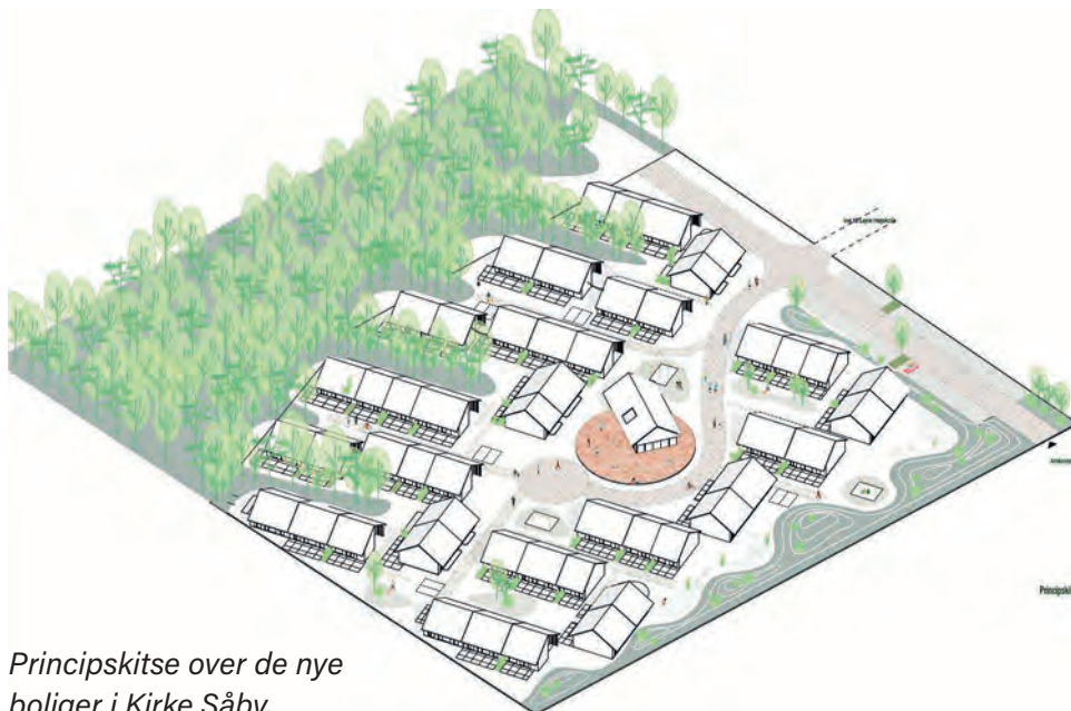
Principskitse over de nye boliger i Kirke Såby.