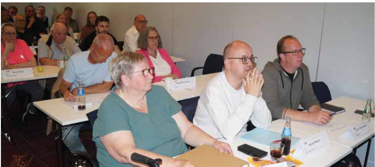
Nye og "gamle" bestyrelsesmedlemmer mødtes ved repræsentantskabsmødet.

interesser (indeks 62). Samlet set svarer 47% af beboerne, at de har kendskab til afdelingsbestyrelsen, mens 42% siger, at de ikke kender afdelingsbestyrelsen. Andelen i hele PAB, som har et godt kendskab ejendomsfunktionærerne, er ca. 50% og andelen, som ikke kender ejendomsfunktionæ-