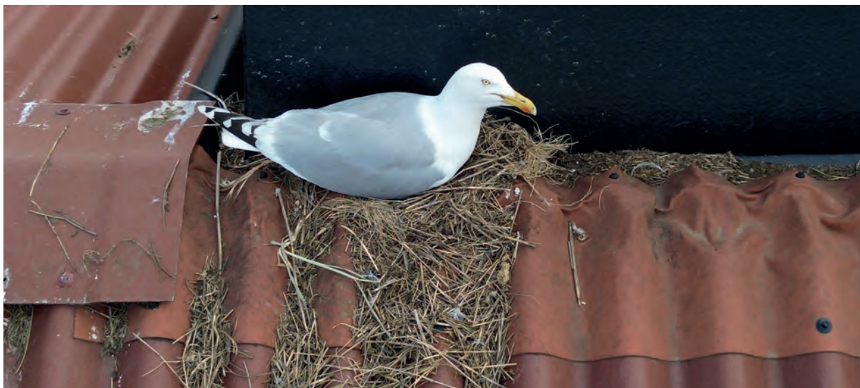
Måger er meget trofaste. De vender altid tilbage til det sted, hvor de selv er blevet udklækket.

– Når man bor i et område, hvor man deler gård med flere styrelser og virksomheder, som vi gør på Carl Jacobsens Vej, er det en god ide at få dem alle involveret i projektet, da mågerne ellers søger over på de tage, som ikke er en del af bekæmpelsen. Og så kan det virke lidt omsonst at poste 25.000 kr. i en bekæmpelse, som ikke virker 100 procent.