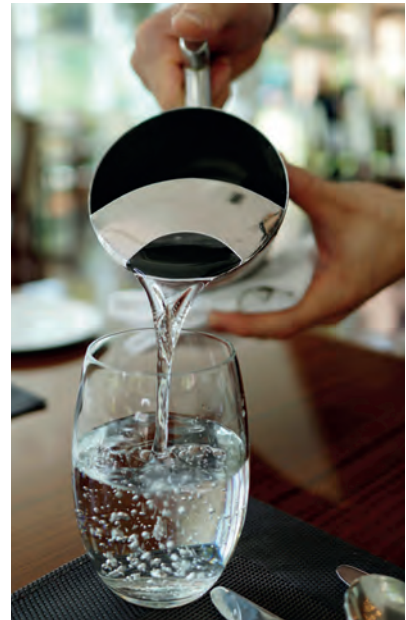
Sørg for, at du har et køligt sted til at opbevare dine forsyninger.

Ifølge statens anbefalinger så skal vi preppe, have nødforsyninger klar, hvis der fx er langvarige strømafbrydelser eller alvorlige vejrphenomener, der kan forlænge den tid, det tager for redningshold at nå frem.