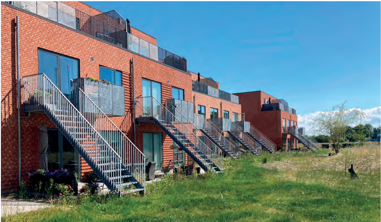
Det var PAB, der fik ideen til at bygge generationshusene tilbage i 2018.