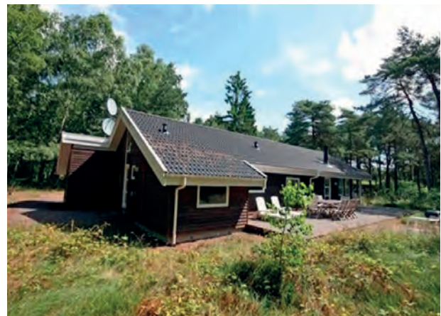
På solskinsøen Bornholm finder man det mest populære sommerhus.

Som økonomien ser ud pt., så er det sommerhusene i Sverige og Skagen, som kører med det største underskud – og det vil formentlig være dem, der vil blive solgt først, hvis ikke udlejningen stiger.