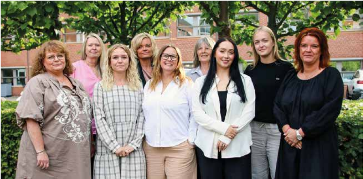
Teamet i Udlejningen står altid klar til at vejlede og rådgive om muligheder for en ny bolig